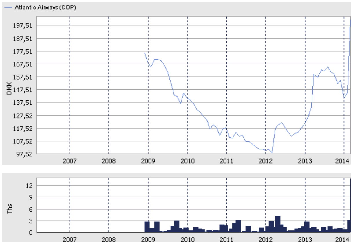
Atlantic Airways (COP) Hlutabréf

Hér fyrir neðan má sjá þróunina á verði og veltu hlutabréfa Atlantic Airways bæði á NASDAQ OMX Copenhagen og NASDAQ OMX Iceland.