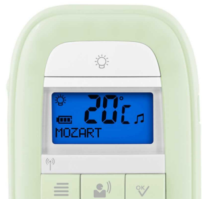
Bm48 med inbyggd temperaturmätare

Parallellt med lanseringen av bm48 släpper Doro även bm46, även den helt störningsfri och med lång räckvidd men utan vaggvisor och LCD-display. Båda modellerna är designade i äpplegrön/vit färg.