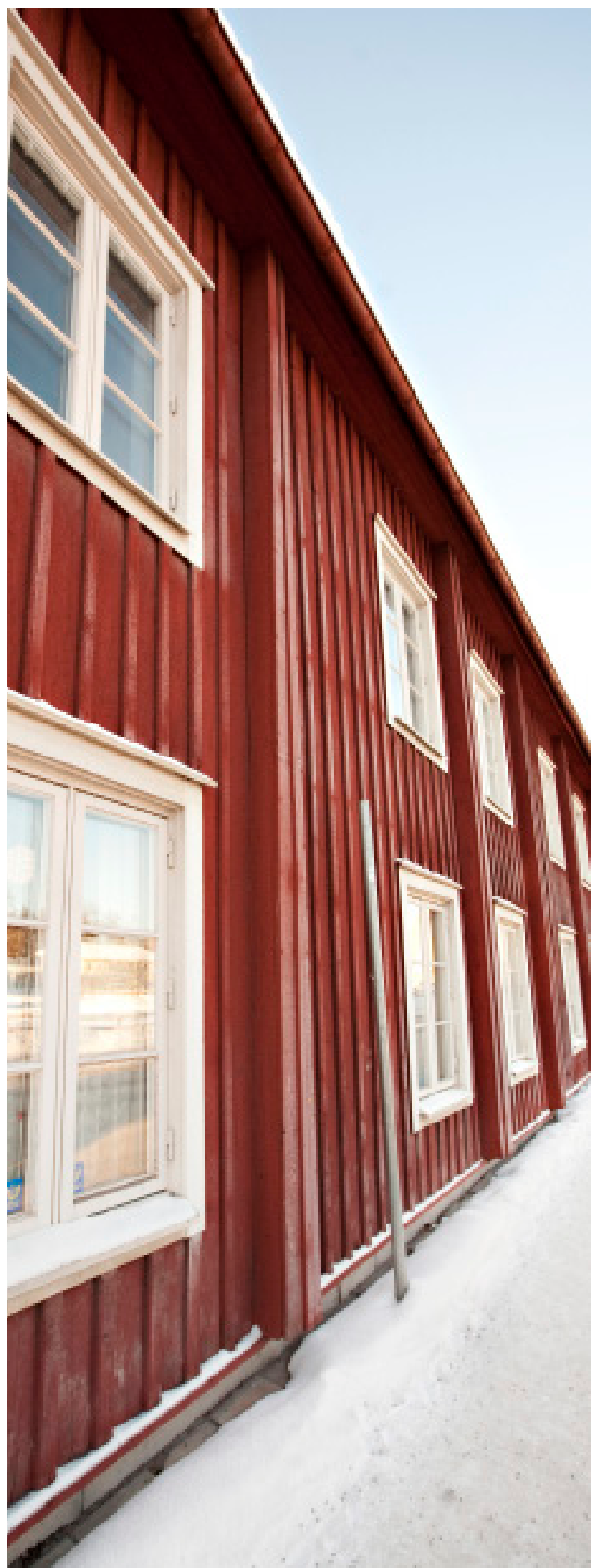
Kansliet 20, Falun

Årsredovisning 2008 finns tillgänglig på www.dios.se