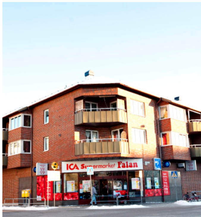
Förädlingsprojekt, Köpmannen 4, Falun

• Diös Fastigheter har i två olika transaktioner under juli månad sålt fastigheterna Mossarotträsk 1:326 i Skellefteå och Svanen 17 i Ludvika med en total uthyrningsbar yta om ca 3 576 m 2 . Försäljningspriset uppgick till 10,5 Mkr, vilket överensstämde med senaste värdering. Tillträdesdag var den 1 juli 2009.