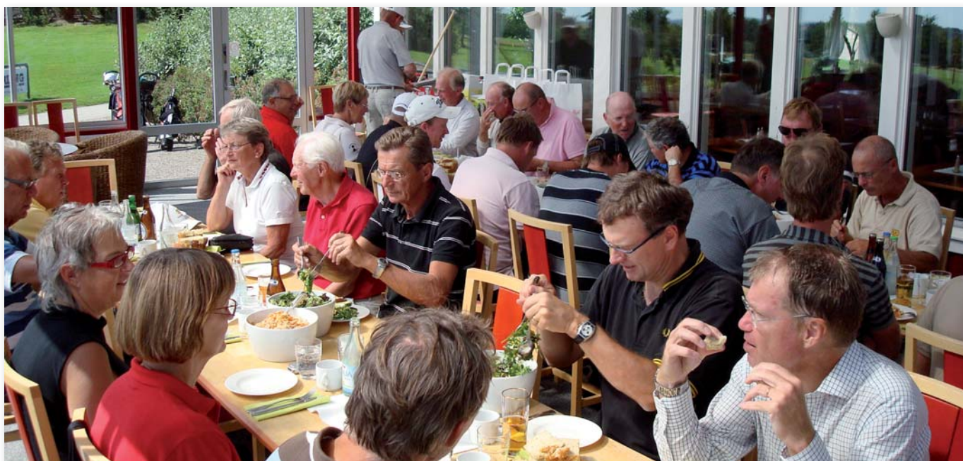
Efter avslutad golfgrunda serverades det lunch i samband med prisutdelningen i restaurangen på Svalövs GK.