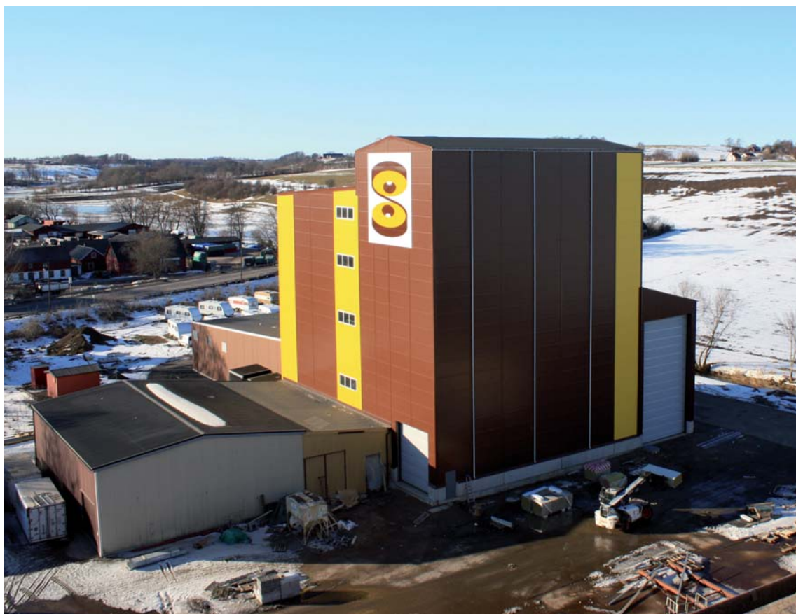
I februari 2010 står byggnaden till den nya specialfabriken klar och nu pågår maskininstallationer invändigt. I juni 2010 beräknar vi kunna göra de första testkörningarna.