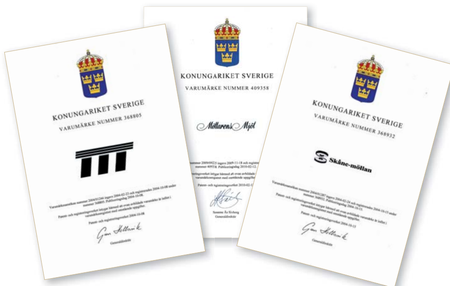
Skåne-möllans tre verksamhetsben är också registrerade varumärken. Vårt varumärke mot detaljhandel-och storkökgrossister, Möllarens Mjöl, blev registrerat i februari 2010.