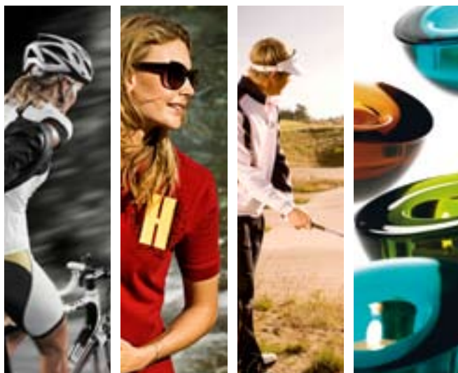
Bilder från Craft, Grizzly, Cutter & Buck, och Orrefors.