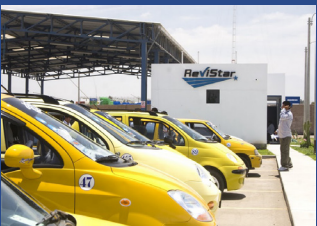
Opus första bilprovningsanläggning i Ica, Peru, där koncernen är verksam under namnet ReviStar