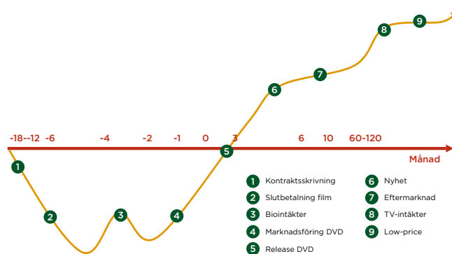
EN FILMS LIVSCYKEL

Förvärv av film- och TV-rättigheter är en nyckelfunktion för en distributör i filmbranschen. Förmågan att förvärva rättigheter med en försäljningspotential över lång tid är väsentligt då förvärven initialt påverkar kassaflödet negativt. Marknaden för filmdistribution i Sverige omsatte 2011 totalt ca 4200 MSEK 1 . DVD/Blu-ray-försäljningen stod för nästan hälften av omsättningen.