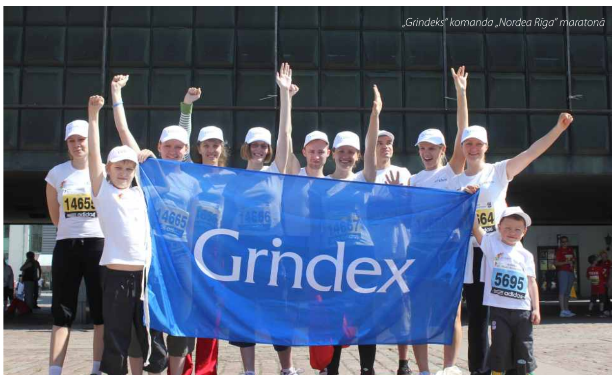
„Grindex” komanda „Nordea Rīga” maratonā

„Grindex” sekmē aktīvu un veselīgu dzīvesveidu, un „Grindex” piedalās vietēja un nacionāla sporta pasākumos. Papildus neskaitāmiem un daudzpusīgiem pasākumiem, kuros aktīvi iesaistās uzņēmuma darbinieki, „Grindex” ir kļuvis par vienu no galvenajiem Latvijas populārākā sporta veida – hokeja veicinātājiem. Jau vairāku gadu garumā, stiprinot sabiedrībā idejas par sportisku dzīvesveidu, „Grindex” ir Latvijas valstsvienības hokejā ģenerālsponsors. „Grindex” lepojas ar iespēju atbalstīt profesionālus sportistus un komandas, un nest Latvijas vārdu pasaulē.