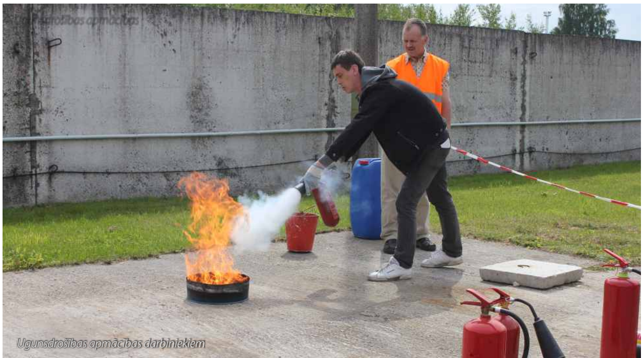
Ugunsdrošības apmācības darbiniekiem

Domājot par darbinieku veselību un drošību, „Grindeks” ir izstrādājis un stingri ievēro darba vides drošības principus. Darba vides un drošības jautājumi uzņēmumā tiek risināti metodiski, un tie ir integrēti darba procesā. Uzņēmumā ir izveidota visaptveroša darba vides risku mazināšanas sistēma, iesaistot arī vadību un aptverot praktiski visus procesus.