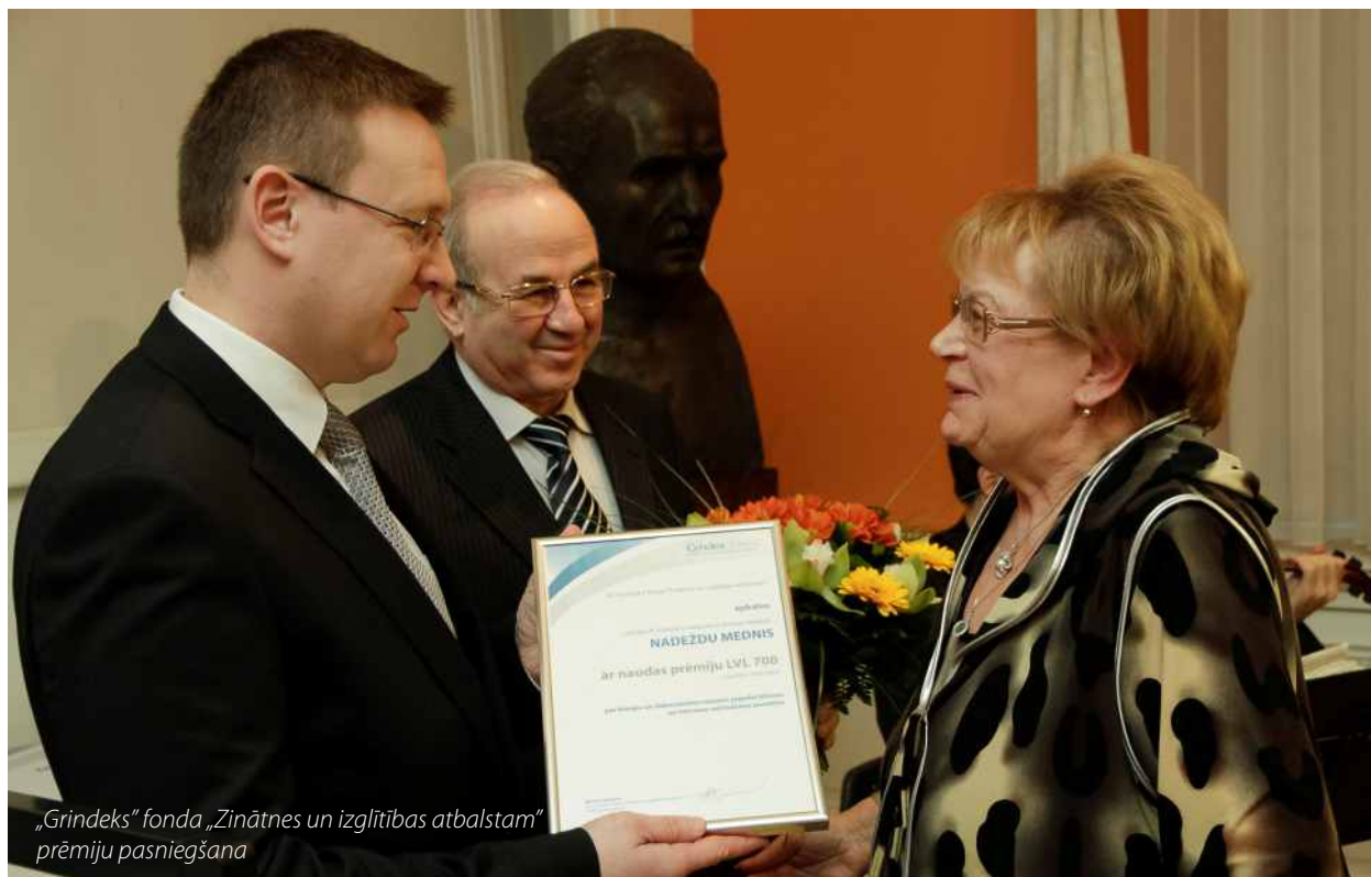
„Grindeks” fonda „Zinātnes un izglītības atbalstam” prēmiju pasniegšana

2011. gada decembrī Rīgas Tehniskās universitātes Materiālzinātnes un lietišķās ķīmijas fakultāte sadarbībā ar „Grindeks” un citiem nozares uzņēmumiem pasniedza balvas 18 Latvijas labākajiem ķīmijas un dabaszinātņu skolotājiem kā pateicību par veiksmīgu un regulāru topošo ķīmijas studentu sagatavošanu.