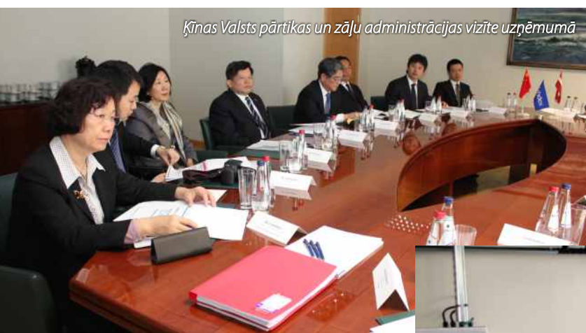
Ķīnas Valsts pārtikas un zāļu administrācijas vizīte uzņēmumā

„Grindeks” biedra statusā darbojas vairākās nozarī pārstāvošās organizācijās – Latvijas ķīmijas un farmācijas uzņēmēju asociācijā, Latvijas tirdzniecības un Rūpniecības kamerā, Latvijas Darba devēju konfederācijā, Latvijas