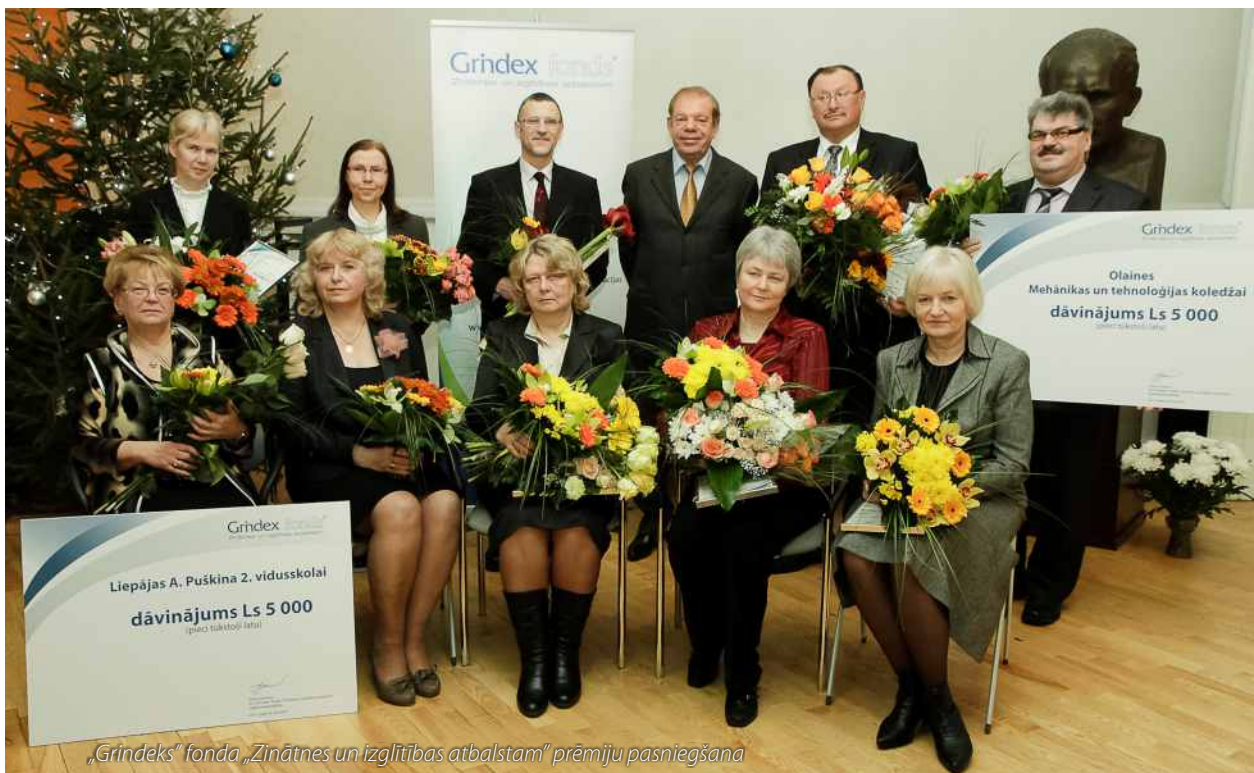
„Grindeks” fonda „Zinātnes un izglītības atbalstam” prēmiju pasniegšana

Ar mērķi apvienot uzņēmuma īstenotos izglītības atbalsta projektus un veicināt speciālistu izaugsmi un izglītības kvalitāti inženierzinātnēs, dabaszinātnēs un farmācijā, 2006. gadā „Grindeks” izveidoja fondu „Zinātnes un izglītības atbalstam”.