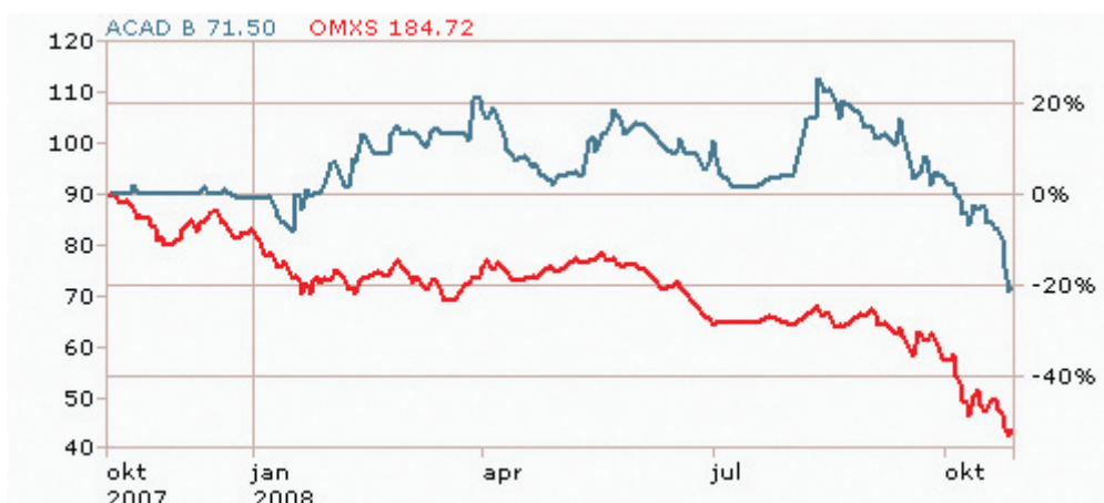
AcadeMedia aktieutveckling under perioden oktober 2007 till oktober 2008, jämfört med OMX index