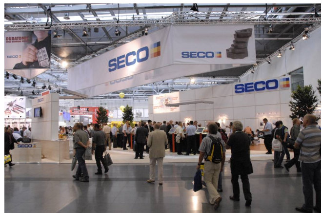
Seco Tools monter vid AMB mässan i Tyskland

Våra planerligt stora marknadsatsningar med bland annat en utökning av säljkåren kombinerat med ett mycket starkt produktprogram har positionerat oss för en fortsatt tillväxt relativt marknaden. Den rådande finansiella oron och konjunkturella avmattningen skapar dock en ökad osäkerhet kring det framtida efterfrågeläget.”