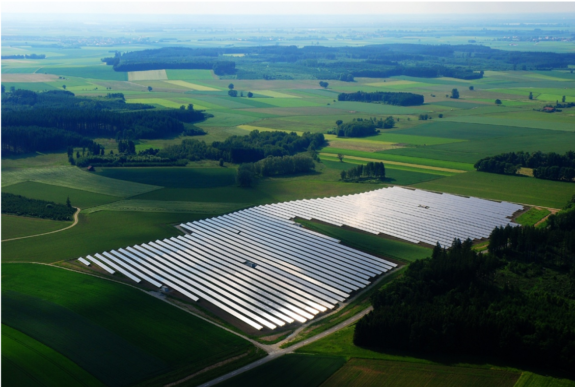
Solcellepark Moorenweis – 5,9 MWp

Solcelleparken forventes endeligt færdiginstalleret og i drift primo november 2008 og leveres i moduler af 1,4 MWp.