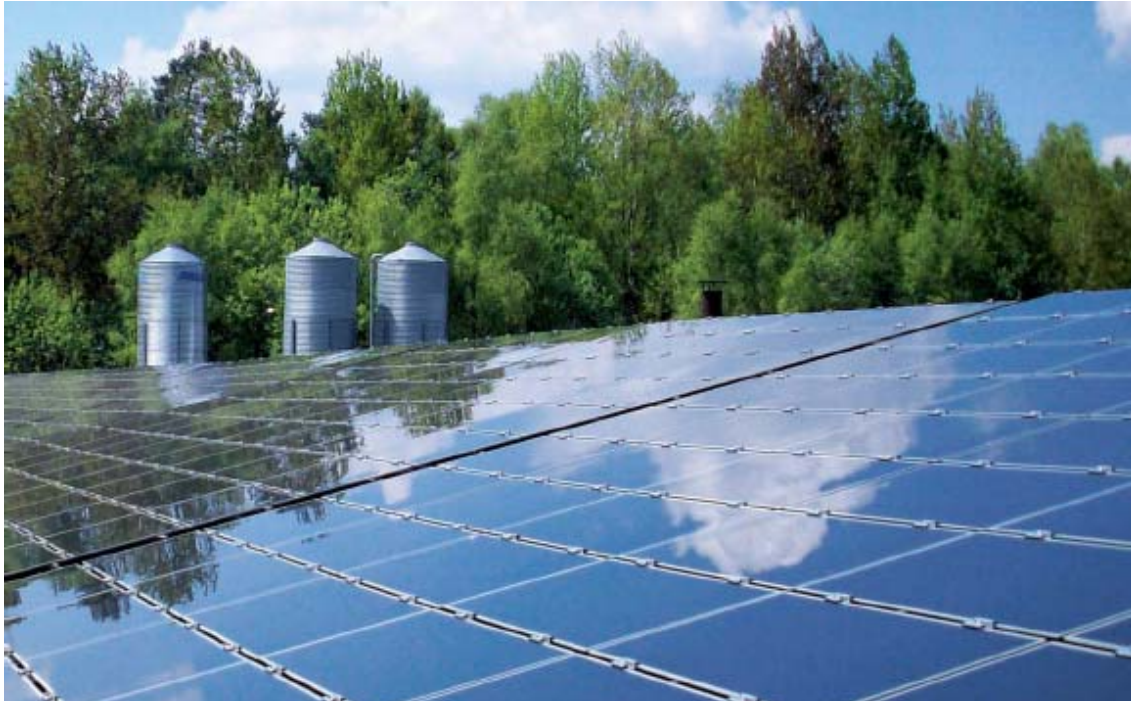
Solcellepark Waldeck – 3,0 MWp

I forbindelse med en revurdering af projektplanen er endelig juridisk overtagelse ændret fra juli 2008 til november 2008. Solcelleparken er tilsluttet nettet og Renewagy modtager indkomst herfra med virkning pr. juli måned 2008.