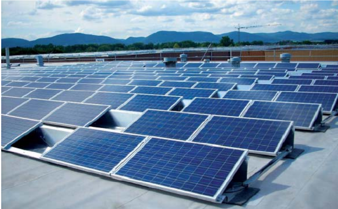
Solcellepark Michelin I – 1,9 MWp