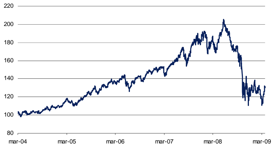
Figur 3: Historisk kursudvikling, Underliggende Aktiekurv, marts 2004 – marts 2009

Den historiske kursudvikling i den Underliggende Aktiekurv er gengivet i Figur 2. Det skal understreges, at den historiske kursudvikling ikke nødvendigvis har nogen sammenhæng med den fremtidige kursudvikling.