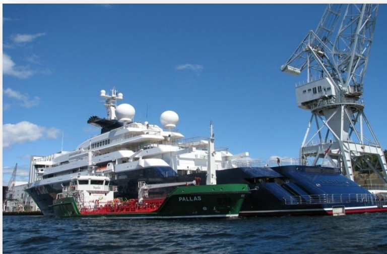
M/T Pallas bunkrar en lyxyacht med diesel i Norge.