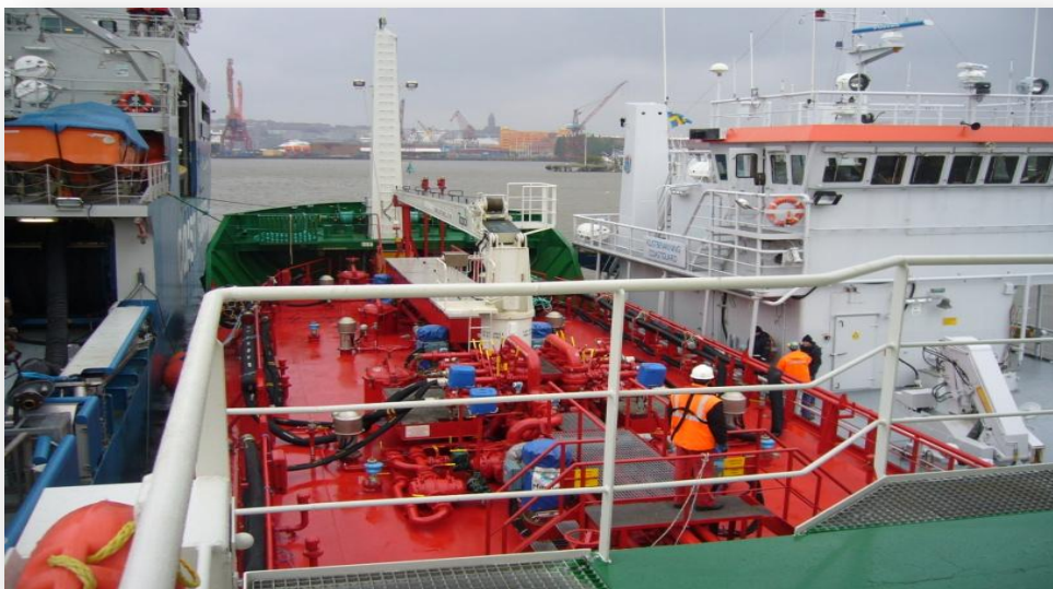
M/T Pallas medverkar i övning med Kustbevakningen i Göteborgs hamn.

Jämförelsetalen från tidigare perioder avseende koncernen är justerade mot tidigare rapporter, då Pallas Petroleum Inc. numera konsolideras i koncernredovisningen. Tidigare perioder har koncernen hänvisat till undantagsreglerna i ÅRL 7 kap 5§ då det förelegat svårigheter att få tag i tillräcklig information i tid.