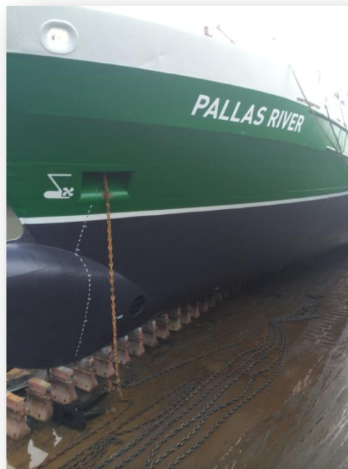
Pallas River nymålad i torrdockan innan sjösättning.

Bolaget har gjort bedömningen att marknaden för denna typ och storlek av fartyg är på uppåtgående och har därför valt att sysselsätta dessa två fartyg i spotmarknaden istället för att binda upp dem på längre kontrakt till en fast TC-net.