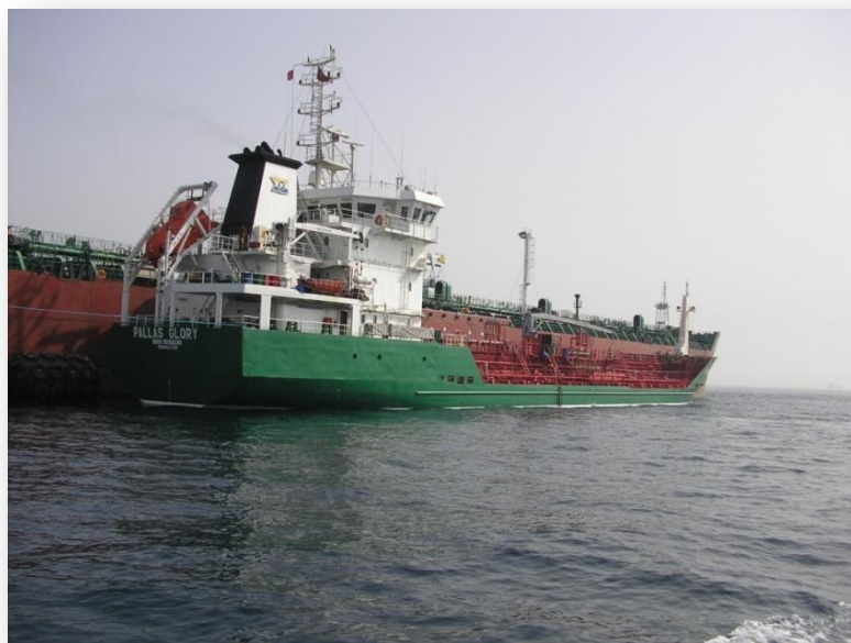
Pallas Glory i Gibraltar

Inga väsentliga händelser har skett under perioden.