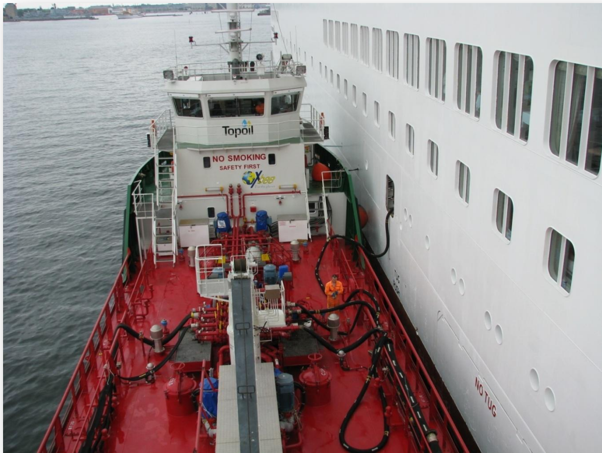
M/T PALLAS förser ett kryssningsfartyg i Köpenhamn med bränsle.