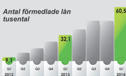
Antal förmedlade lån tusenst