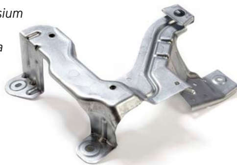
Finnveden Metal Structures utbud av plåtpressade komponenter har en betydande bredd gällande storlek och komplexitet. På bilden ser vi en kanisterkonsol.

Finnveden Metal Structures serietillverkar komponenter i stål och magnesium eller i kombinationer av dessa material. De huvudsakliga tillverkningsprocesserna är pressning, gjutning och sammansättning. Komponenterna innefattar bland annat interiör-, chassi- och karossdetaljer för fordonsindustrin men även kundspecifika komponenter till allmänindustrin.