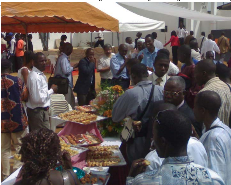
Festligheter vid lansering hos Orange i Guinea Conakry.

1 Från början är USSD de meddelanden som skickas enligt modellen: