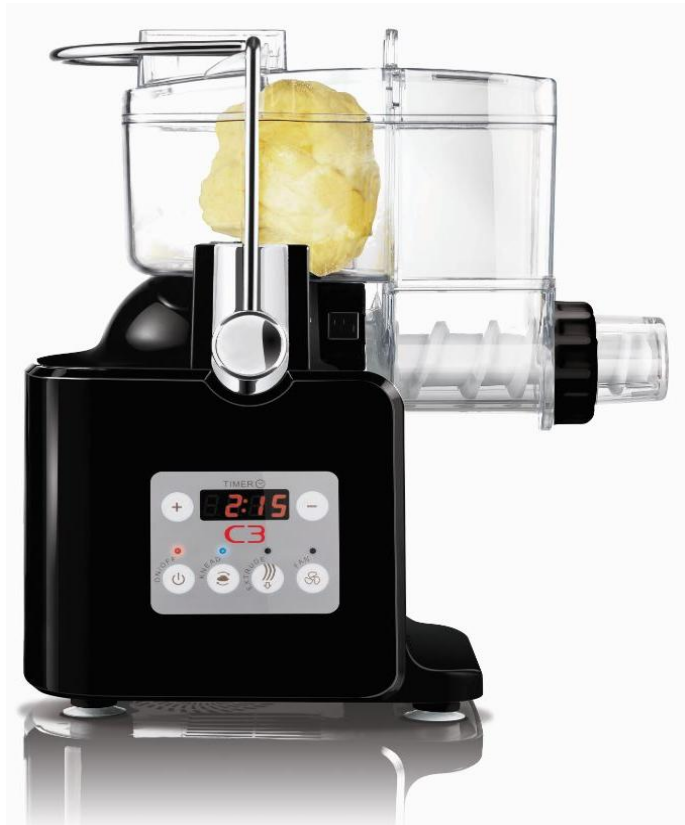
C3 Pasta Basta