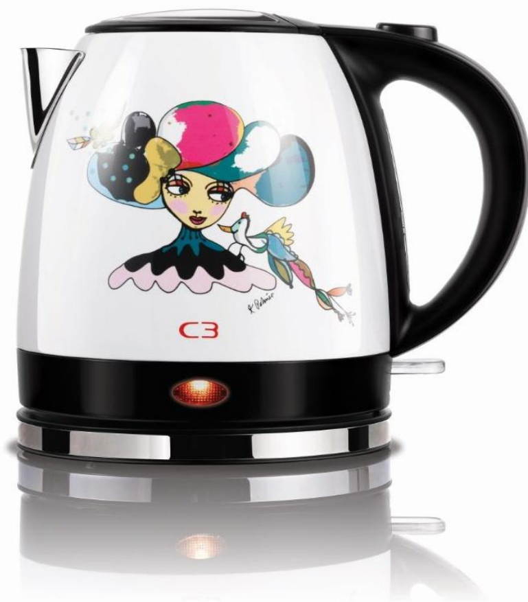
C3 Vattenkokare med motiv av Karolina Palmér

Periodens kassaflöde från den löpande verksamheten före förändring av rörelsekapital var -5,5 mkr (-15,9). Förändring i rörelsekapital påverkade kassaflödet positivt med 10,8 mkr (-6,7). Kassaflödet från investeringsverksamheten var -0,1 mkr (-10,8). Kassaflödet från finansieringsverksamheten var -8,0 mkr (12,2). Periodens kassaflöde uppgick till -2,7 mkr (7,8).