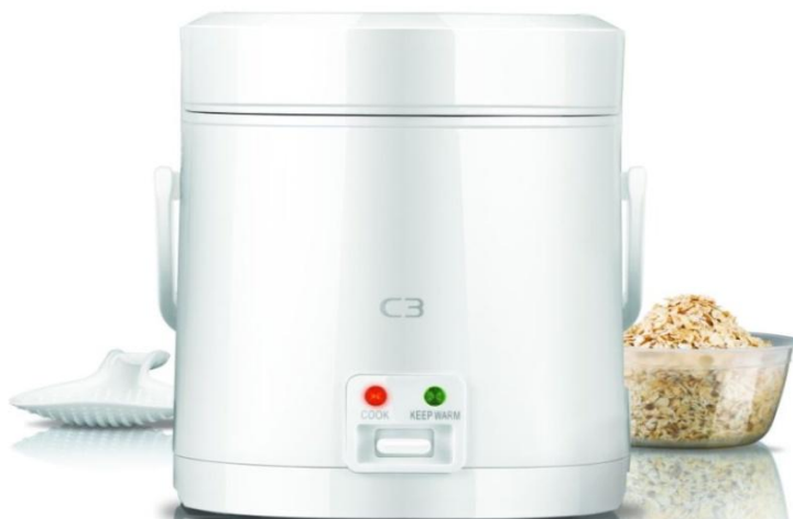
C3 Kick Start Grötkokare