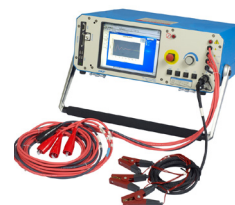
SKF Static Motor Analyzer Baker AWA-IV