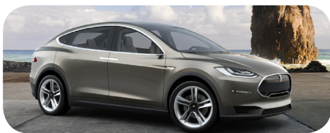
Tesla Model X