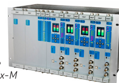
SKF Multilog On-line System IMx-M