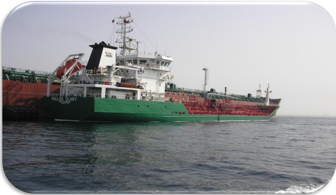
Bunkringsfartyget Pallas Glory utför en bunkring i Gibraltar.