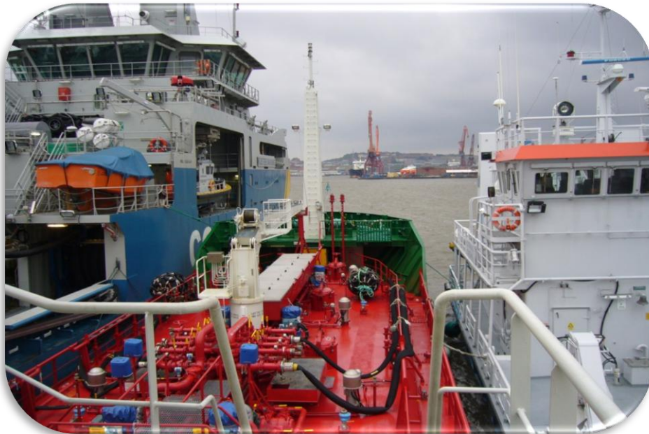
M/T Pallas medverkar i övning med Kustbevakningen.