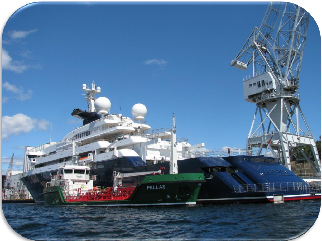
M/T Pallas förser en lyxyacht med bränsle.