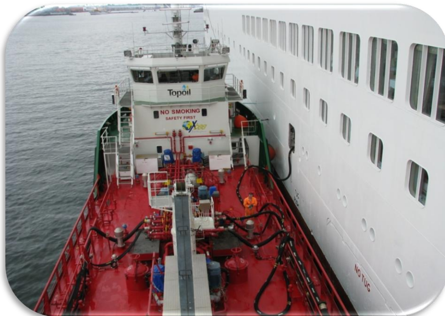
M/T PALLAS förser ett kryssningsfartyg i Köpenhamn med bränsle.

**Externa värderingar, utifrån dagens inseglingsrater, av bunkerfartygen visar ett övervärde på 24,4 Mkr jämfört med bokfört värde.