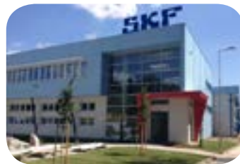
Fabriken för smörjsystem i Tjeckien