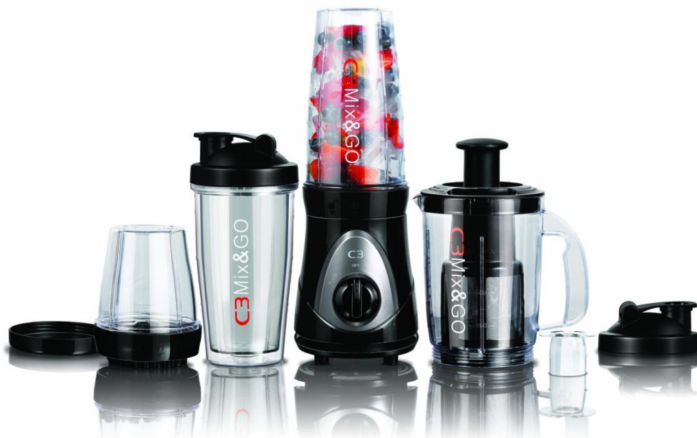
C3 - Mix & Go

Periodens kassaflöde från den löpande verksamheten före förändring av rörelsekapital var 11,7 mkr (-12,0). Förändring i rörelsekapital påverkade kassaflödet positivt med 18,3 mkr (7,3). Kassaflödet från investeringsverksamheten var -0,1 mkr (-14,1). Kassaflödet från finansieringsverksamheten var -10,1 mkr (15,8). Periodens kassaflöde uppgick till 0,9 mkr (-10,2).