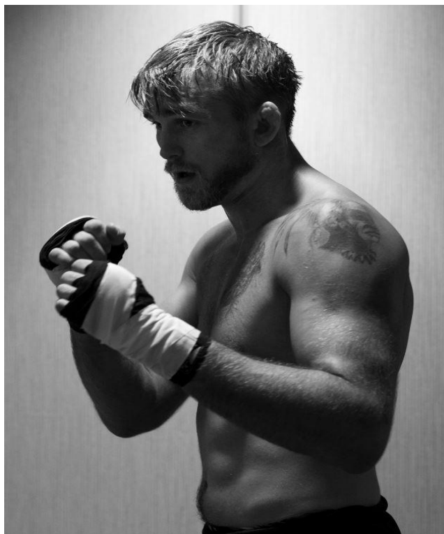
Alexander "The Mauler" Gustafsson

Empire konsoliderar balansräkningen och drar kraftigt ned redovisat resultat genom att skriva ned de immateriella tillgångarna med totalt 15.7 MSEK till noll.