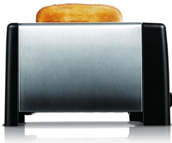
C3 - Toaster