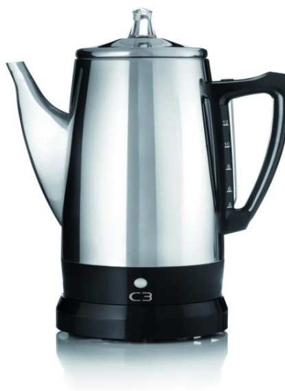
C3 - Percolator