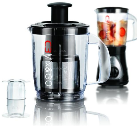
C3 - Juice Jar