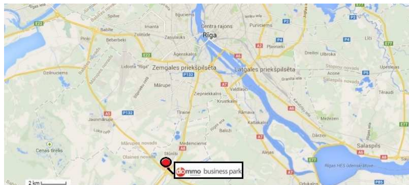
AB „INVL Baltic Real Estate“ įmonių grupės nekilnojamojo turto objektai Rygoje