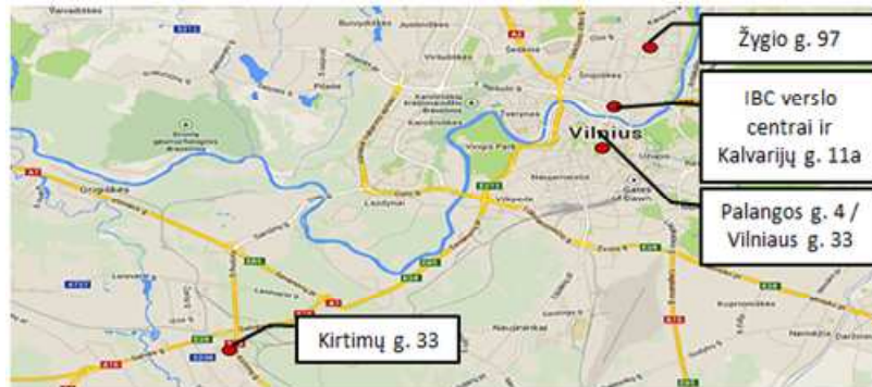
AB „INVL Baltic Real Estate“ įmonių grupės nekilnojamojo turto objektai Vilniuje