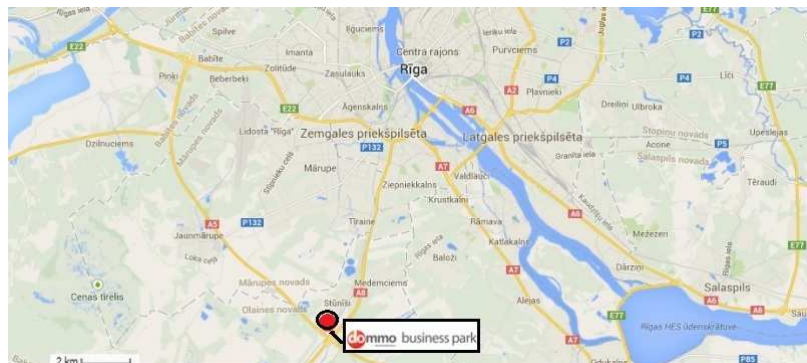
AB „INVL Baltic Real Estate“ įmonių grupės nekilnojamojo turto objektai Rygoje