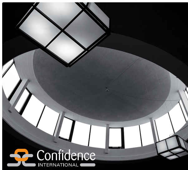
Motiv: Stadsarkivet, Stockholm