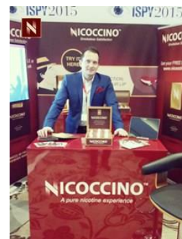
Nicoccinos presentation på ISPY