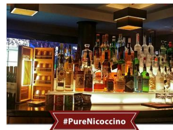
Nicoccino på Aspers