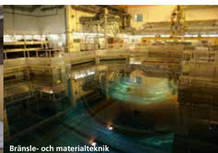
Bränsle- och materialteknik