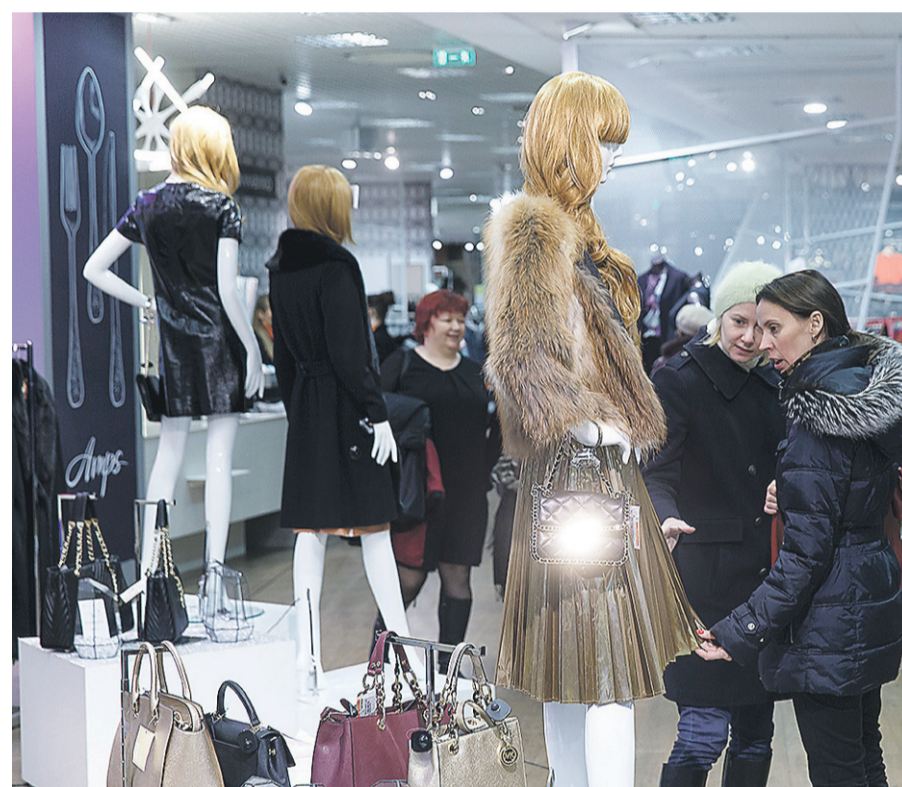
↑ TALLINNA KAUBAMAJA ajalooline tootlus on Tallinna börsi parim ja ka maailma mõistes tubli tulemus.