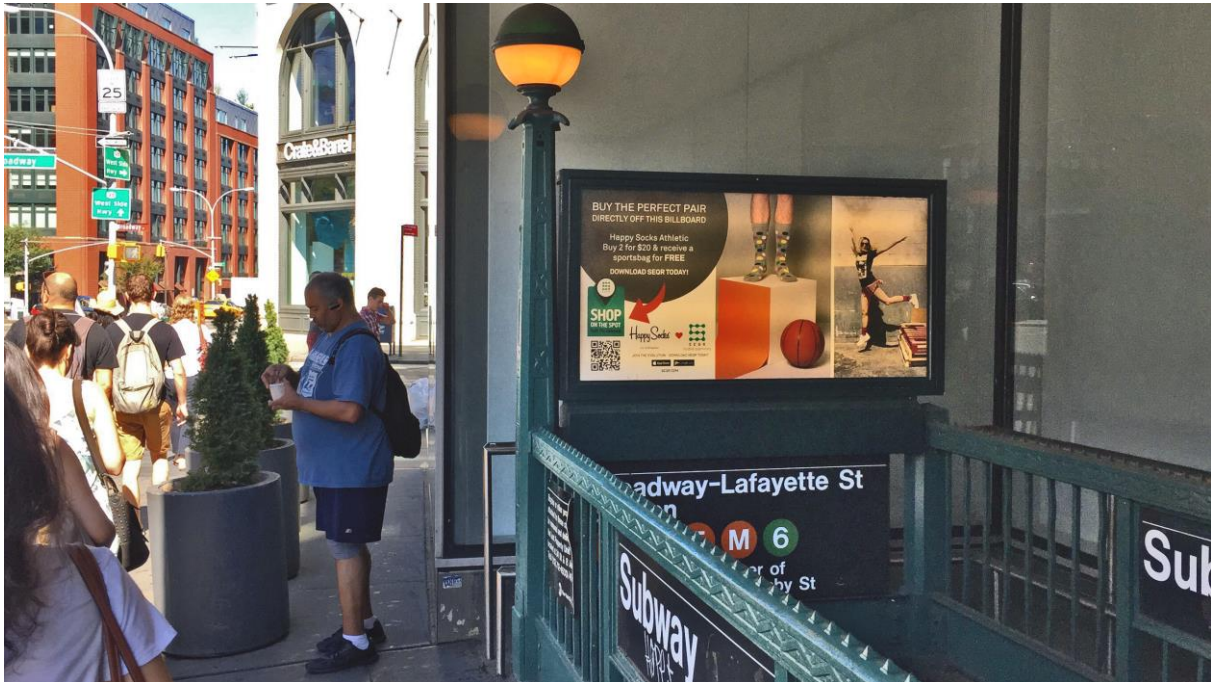
Utomhusannonser med SEQR i New York, USA.

Både USA och Storbritannien är mycket avancerade marknader när det gäller mobila och digitala betalningar, vilket innebär ett mycket konkurrensutsatt landskap. Några stora förbättringar kommer dock att betydande stärka vår position och accelerera vår tillväxt på dessa marknader.