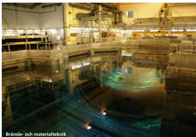
Bränsle- och materialteknik

Såvitt inget annat anges avser informationen i text och siffror verksamheten exklusive verksamhet till försäljning.