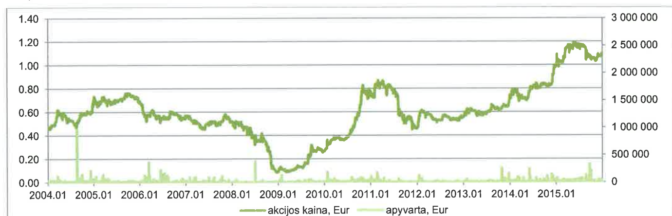
9.2.pav. Akcijos kainos ir apyvarta 2004-01-01 – 2015-12-31.