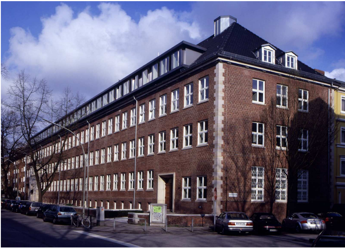
Capee ejendom i Hamburg