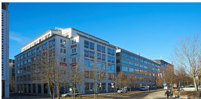
Eken 6 i Sundbyberg.