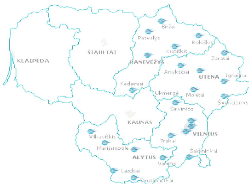
27.1. pav. AB Rytų skirstomųjų tinklų aptarnaujama teritorija

Šiuo metu Bendrovė skirsto ir tiekia elektros energiją per 729 tūkst. klientų 34,8 tūkst. kv. km. Lietuvos teritorijoje: Vilniaus, Panevėžio, Alytaus ir Utenos apskrityse bei dalyje Kauno ir Marijampolės apskričių. Bendrovė atsakinga už žemosios (0,4 kV) ir vidutinės įtampos (35-10 kV) elektros tinklų priežiūrą, patikimumą bei plėtotę ir už elektros energijos tiekiamą vartotojams aptarnaujamoje teritorijoje.