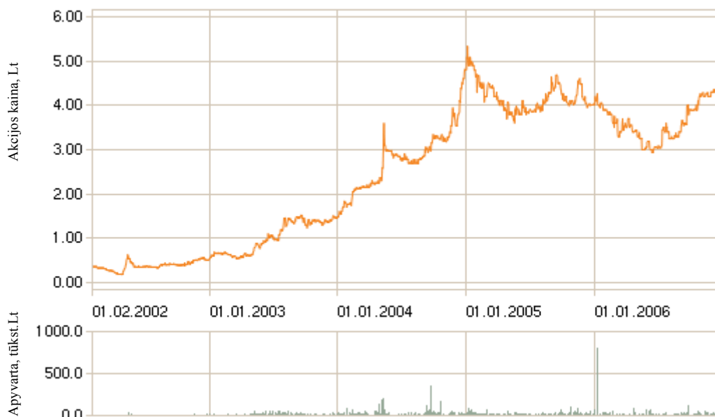
9.1. pav. Prekyba bendrovės akcijomis