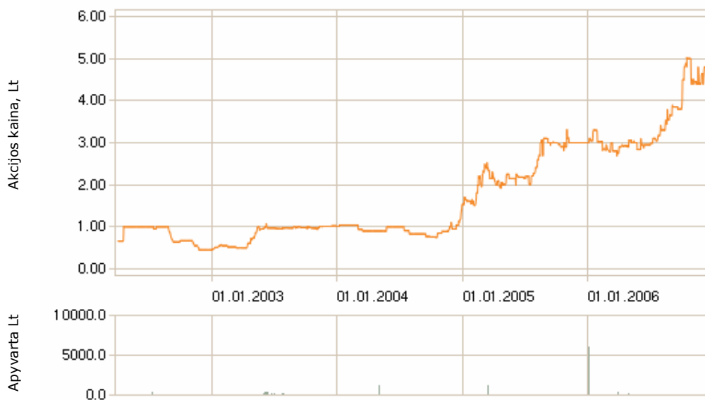
16.1. pav. Prekyba bendrovės akcijomis 2002-03-25 – 2006-12-31