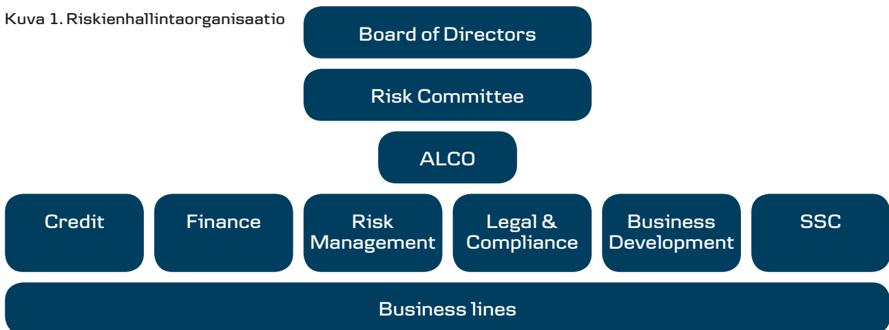
Kuva 1. Riskienhallintaorganisaatio

Sampo Pankki -konsernin Riskienhallinta -yksikkö on liiketoiminnasta riippumaton ja sen tehtävänä on valvoa konsernin riskiasemaa Sampo Pankki Oyj:n hallituksen asettamien periaatteiden ja limiittien mukaisesti. Riskienhallinta on myös vastuussa Sampo Pankki -konsernin pääoman riittävyyden arvioinnista otettuja riskejä vastaan.