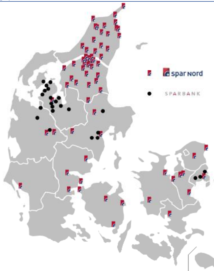
Tabel 4.3 – Spar Nords og Sparbanks filialer

Den Fortsættende Bank vil selv og via samarbejdspartnere udbyde en bred vifte af finansielle ydelser, rådgivning og produkter. Den Fortsættende Bank vil have forretningsmæssigt fokus på private kunder samt mindre og mellemstore virksomheder i de lokalområder, hvor Den Fortsættende Bank er repræsenteret.