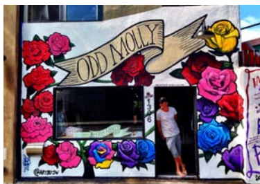
Odd Mollys pop-up-butik i Los Angeles.