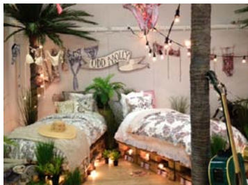
Delar av Odd Mollys bädd-sortiment

Under kvartalet lanserades en badkollektion som ett komplement till den kommande vår- och sommarkollektionen. Efter kvartalets slut lanserades en utökad Home-kollektion, med bädd- och badhanddukssortiment, som ett led i att skapa ett fullt livsstilskoncept.