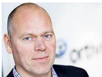
CEO Carl Ekvall

På den svenska marknaden, som bidrar med en väsentlig del av Ortivus omsättning, kommer ett antal uppgraderingar och kompletteringar för CoroNet och MobiMed Smart att ske under året. Successivt växer våra tjänsteintäkter från tillägsbeställningar och integrationsprojekt. Vi ser också möjligheter att komplettera MobiMed Smart plattformen med applikationer för att därigenom bredda basen för vår verksamhet. Vi utesluter heller inte nya geografiska marknader under de kommande åren.