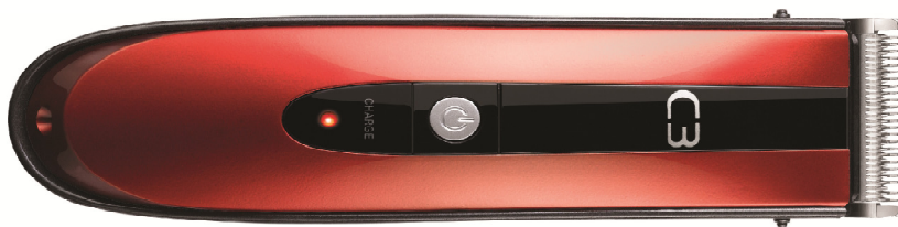
The Mauler Collection - Powertrim