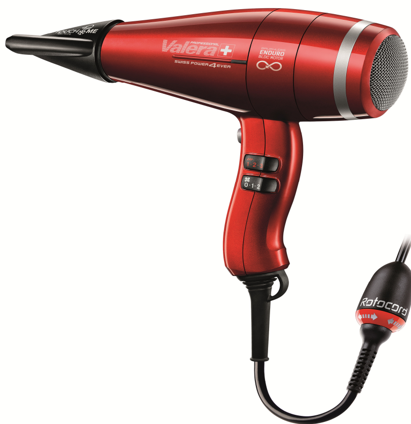
Valera Swiss Power4Ever

Periodens kassaflöde från den löpande verksamheten efter förändring av rörelsekapital var -1,7 mkr (3,7). Kassaflödet från investeringsverksamheten var 0,0 mkr (0,0). Kassaflödet från finansieringsverksamheten var 2,0 mkr vilket består främst av upptaget av aktieägarlån (-5,4). Periodens kassaflöde uppgick till -2,5 mkr (0,6).