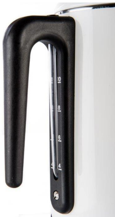
C3 Design perkolator