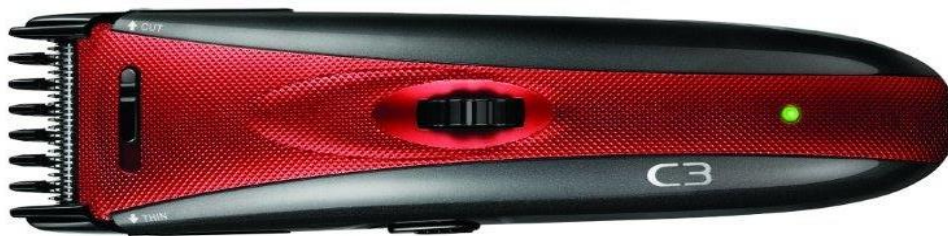
C3 Tools For Men Clip&Roll