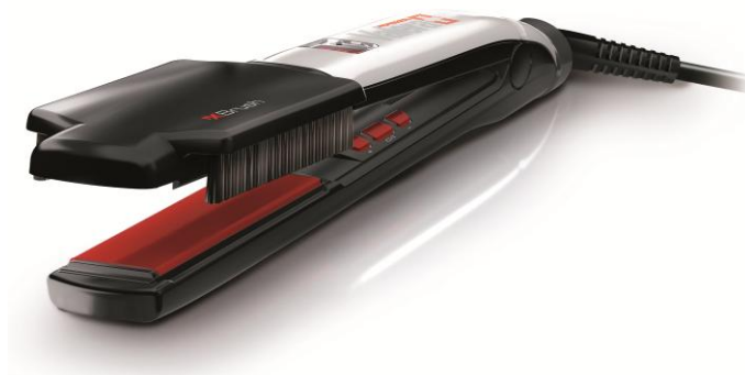
Valera - Swiss'X Brush & Shine