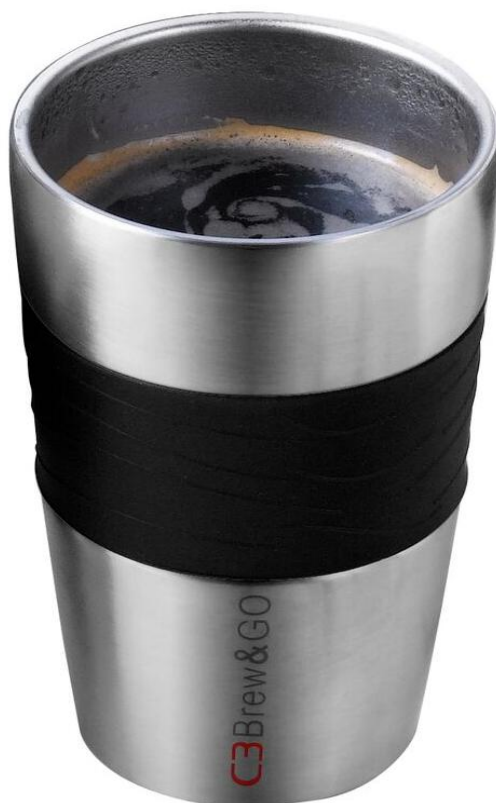
C3 Brew & Go Brygger snabbt varmt gott kaffe direkt i din "to-go" mugg

För perioden januari till juni uppgick kassaflödet från den löpande verksamheten efter förändring av rörelsekapital till -4,3 mkr (5,3). Kassaflödet från investeringsverksamheten var 0,0 mkr (-0,1). Kassaflödet från finansieringsverksamheten var 2,9 mkr vilket består främst av upptaget av aktieägarlån (-8,0). Periodens kassaflöde uppgick till -1,4 mkr (-2,7).