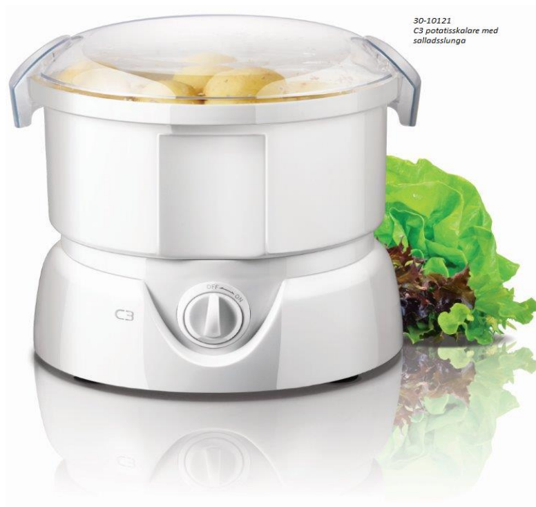
30-10121 C3 potatisskalare med salladsslunga