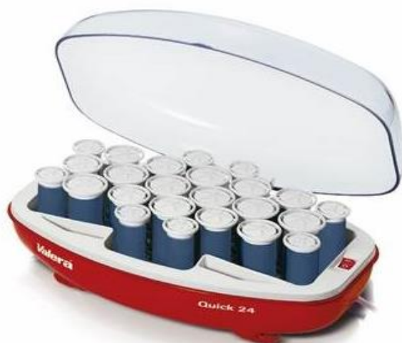
605.01 Valera Quick 24 set med värmepolar