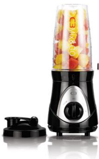
30-10107 C3 Mix&GO®Basic, svart/silver