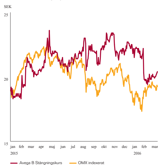
Aktiekursutveckling 1 januari 2015 – 31 mars 2016

Avega Group hade vid periodens utgång 2 332 aktieägare och börsvärdet uppgick till 231 MSEK. Den 31 mars 2015 uppgick betalkursen för Avega Groups aktie till 20,50 SEK. Sista betalkurs den 31 mars 2016 uppgick till 20,40 SEK.