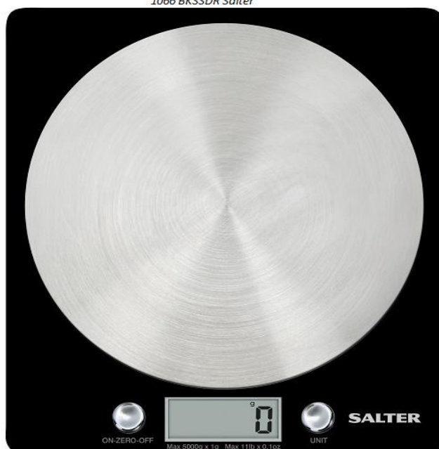
1066 BKSSDR Salter