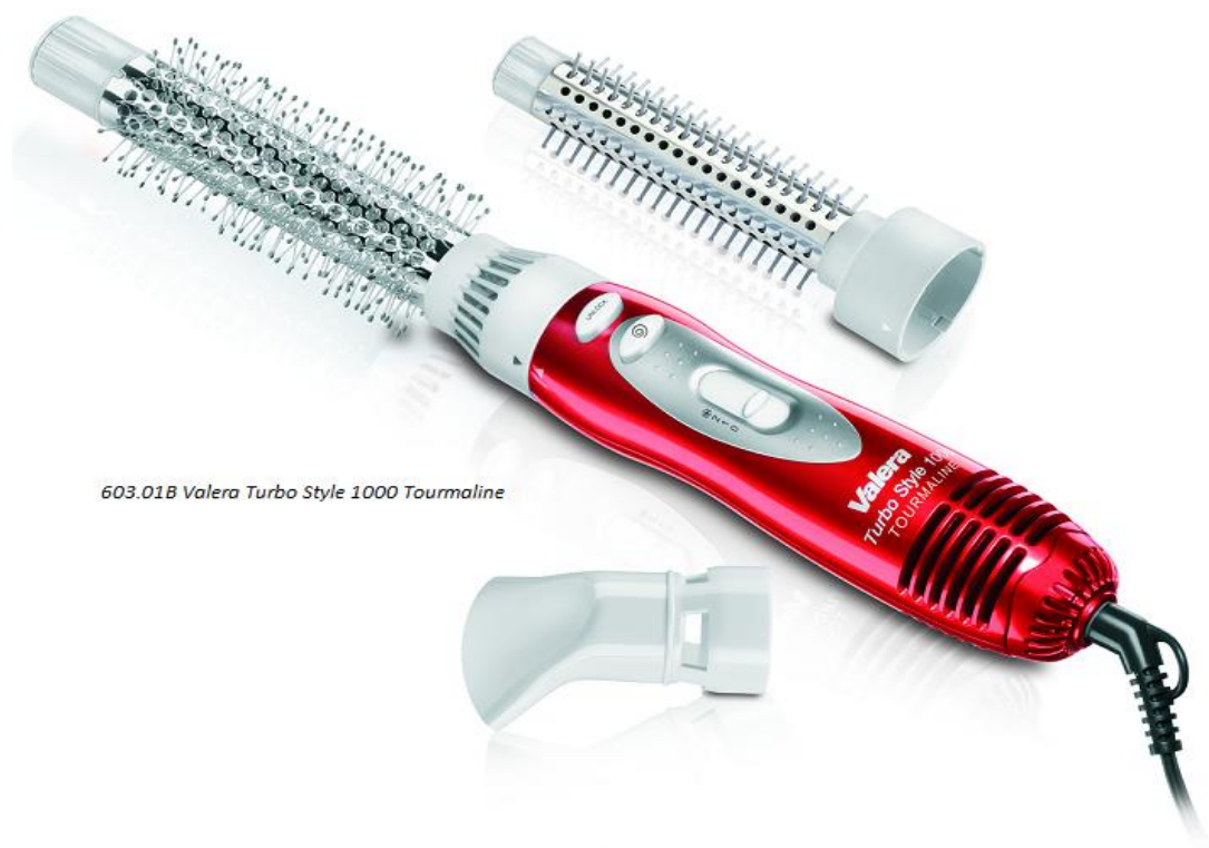
603.01B Valera Turbo Style 1000 Tourmaline