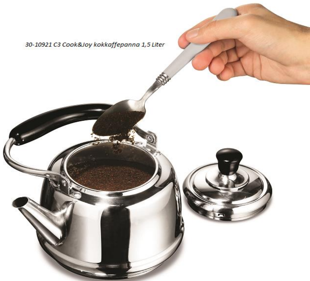
30-10921 C3 Cook&Joy kokkaffepanna 1,5 Liter

Första kvartalets kassaflöde från den löpande verksamheten efter förändring av rörelsekapital var -3,9 mkr (-4,5). Kassaflödet från investeringsverksamheten var 0 mkr (0). Kassaflödet från finansieringsverksamheten blev totalt 0,1 mkr (0). Periodens kassaflöde uppgick till -3,9 mkr (-2,5).