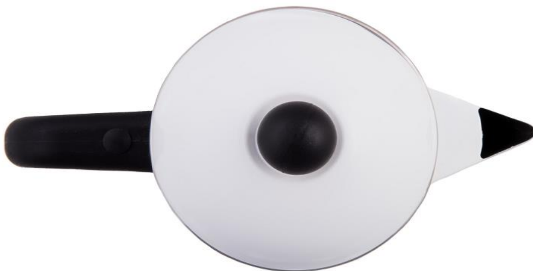
30-30205eco C3 Perkolator 10 koppar, vit