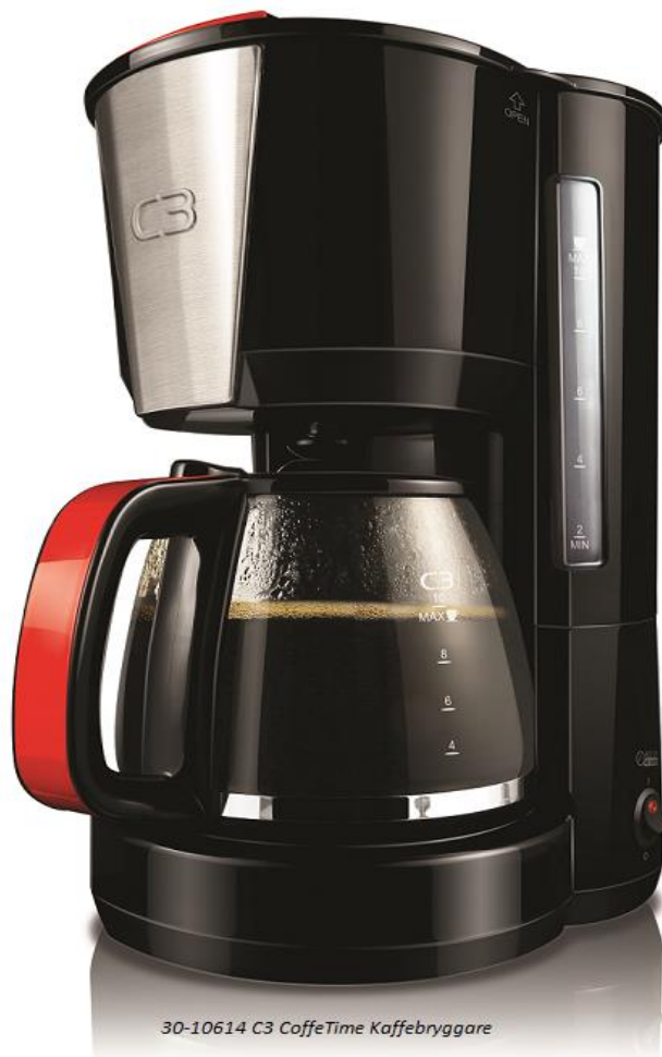
30-10614 C3 CoffeTime Kaffebryggare