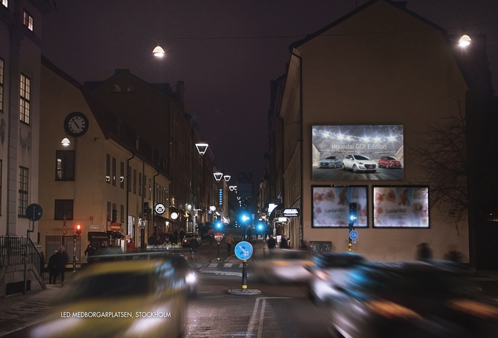
LED MEDBORGARPLATSEN, STOCKHOLM